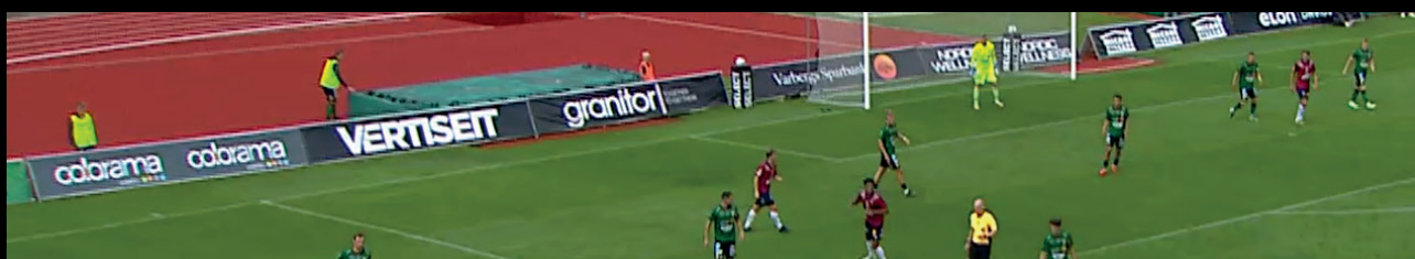
Kortsida, fasta skyltar