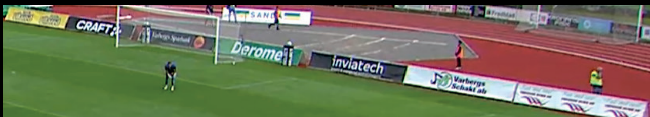
Kortsida, fasta skyltar