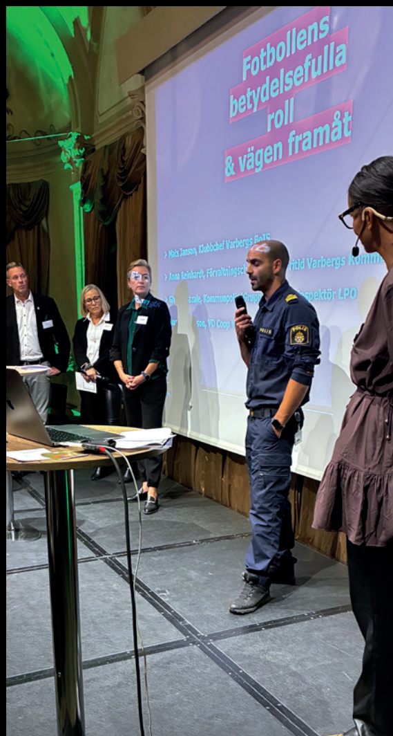
Panelen under "Årets viktigaste kväll" med BoIS i Samhället.